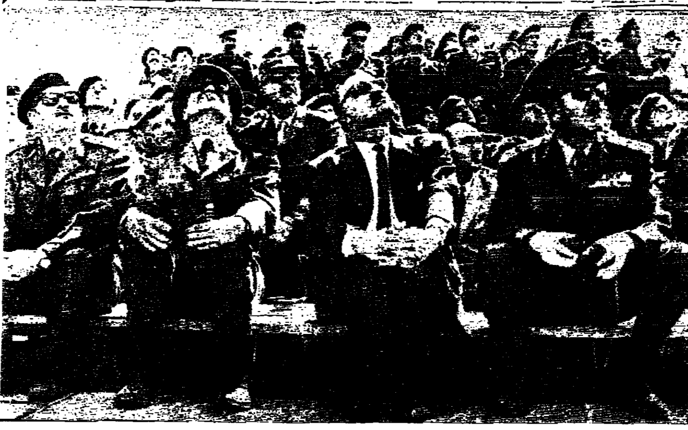
الرئيس جمال عبد الناصر يشهد عملية التدريب الكبيرة في مكان ما من الجمهورية العربية المتحدة وهو يسرى جالسا بين الفريق اول محمد فوزي والترقي عبيد القم رضاي العسكريين